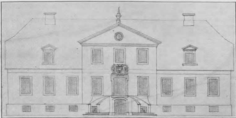
Abb. 2. Herrenhaus zu Gülzow 1786.

Dort, wo heute der Jagdpavillon am Rande des Gülzower Waldes steht, befand sich noch Ende des 18. Jahrhunderts ein Gebäude, wie es die Abbildung 3