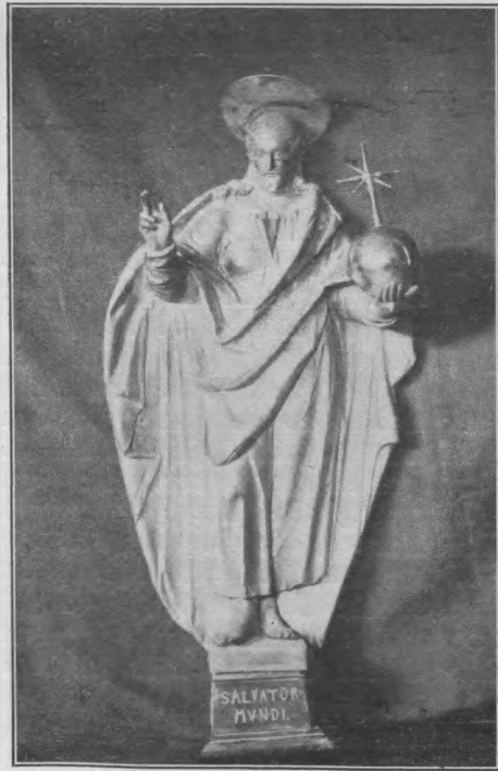
Abb. 2. Phot. A. Sannig, Raseburg. Die silberne Christusfigur im Raseburger Dom.

In diesen Fächern standen ehemals die dreizehn Figuren „in starkem Silber gegossen; inwendig hohl, durchgängig wenigstens in der Dicke eines Guldens“. Christus, „mit der vergoldeten