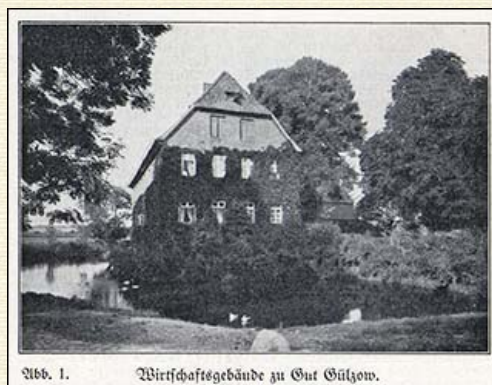
Abb. 1. Wirtschaftsgebäude zu Gut Gülzow.

als geschützter Herrnsitz wegfiel. Es diente den Pächtern des Gutes Gülzow als Wohnung, zeitweise befand sich auch eine Brennerei darin, und heute wird es als Gutswirtschaftsgebäude benutzt unter gleichzeitiger Verwendung als Wohnung für den Gutsinspektor.