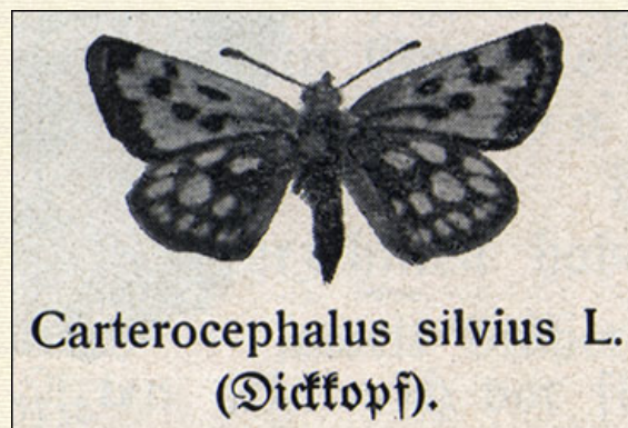
CARTEROCEPHALUS SILVIUS L. (Dickkopf).

4. CARTEROCEPHALUS SILVIUS L. Dieser kleine, gelb und schwarz gezeichnete Tagfalter hat sich seit der Mitte des vorigen Jahrhunderts in Pommern, Mecklenburg, Nordhannover und einem Teil von Lauenburg und Holstein eingebürgert. Bei ihm, einem Falter sibirischer Herkunft, hat sich besonders klar die Weiterwanderung von Osten nach Westen verfolgen lassen. Auch er trat zuerst im Gebiet von LAUENBURG auf. Jetzt ist er westlich bis in die Umgegend von Altona und nordwestlich bis Lübeck und Niendorf a. O. vorgedrungen. Der Falter fliegt von der ersten Juni-Woche an auf feuchten Wiesen an Waldrändern. -