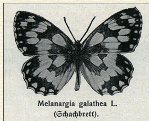
MELANARGIA GALATHEA L. (Schachbrett).

funden und zur Einbürgerung der Art geführt. Seit etwa 1870 ist der Falter von Südosten her dann auch in Mecklenburg eingewandert, wo er jetzt recht verbreitet ist. Ferner ist die Art in der Umgebung von Lüneburg eingewandert.