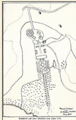
Ausschnitt aus einer Flurkarte vom Jahre 1724.