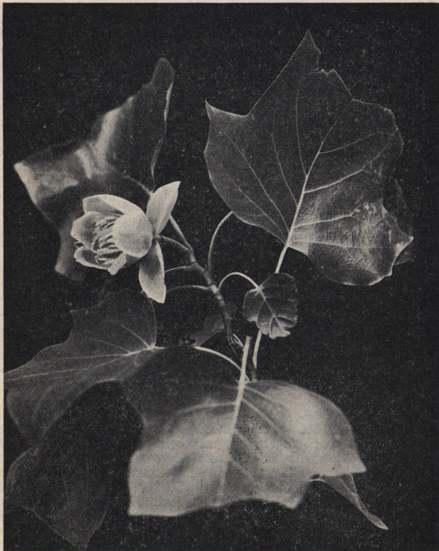
Eine Blüte des Tulpenbaums aus der Umgegend von Ratzburg.