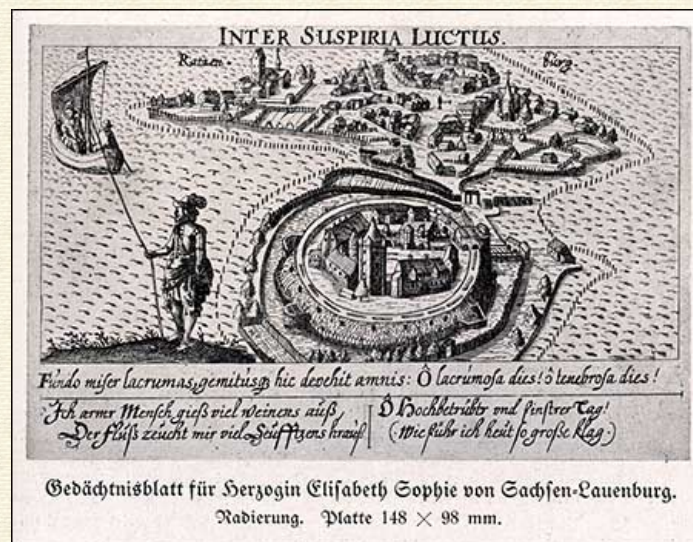
Gedächtnisblatt für Herzogin Elisabeth Sophie von Sachsen-Lauenburg. Radierung. 148 x 98 mm.

Heimatbund und Geschichtsverein Herzogtum Lauenburg e. V. © 2018. www.hghl.info