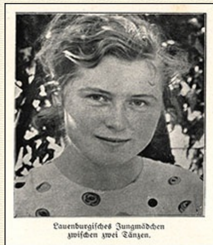
Lauenburgisches Jungmädchen zwischen zwei Tänzern.