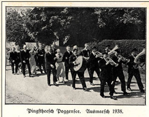
Pingstheesch Poggensee. Ausmarsch 1938 .