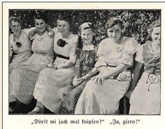
„Dörft wi juch mal knipsen?“ „Ja, giern!“

"Dörft wi juch mal knipsen?" "Ja, giern!"