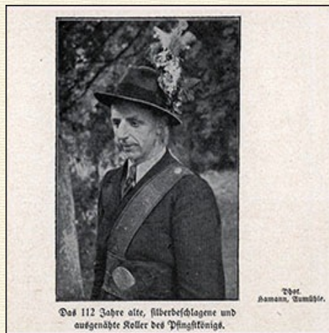
Das 112 Jahre alte, silberbeschlagene und ausgenähte Koller des Pflingstking.

anderswo, müssen sie hier wohl früh verboten worden sein 22 ). Verbotene Feste wurden oft verschoben, am andern Ort oder zu anderer Zeit abgehalten. So mag das 'Duel' in Wentorf die letzte Spur einer Maigrabschaft sein. Auch der Flurname 'Blaumenort, Blumenort' bei Elmenhorst mag auf einen solchen 'Blumen' d. h. Streit deuten, auf ein Turnier um einen Mai- oder Blumengrafen. Irgendwie wurde also immer ein König gekoren. Beim Pfingsttheesch geschah es schließlich immer durch Ringreiten. Das traditionsreichste Reiterfest war vielleicht dasjenige in Gudow, dessen beide Fähnlein noch auf einen alten Gruppenkampf zwischen Sommer und Winter deuten.