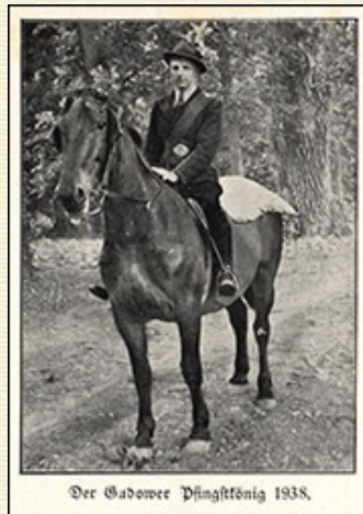
Der Gudower Pfingstkönig 1938.