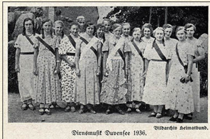
Dirnsmusik Duvensee 1936.

Da aber sonst von den Nachbarn ZÜCHTIGE GELAGE, fröhliche Zusammenkunft nach gehaltener Nachmittagspredigt werden gehalten, können wir der Jugend in EHREN FRÖHLICH ZU SEIN, da ihre Eltern, Herren und Frauen gegenwärtig, wohl gönnen und zulassen 23 ).