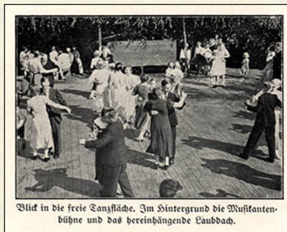
Blick in die freie Tanzfläche. Im Hintergrund die Musikantenbühne und das hereinhängende Laubdach.