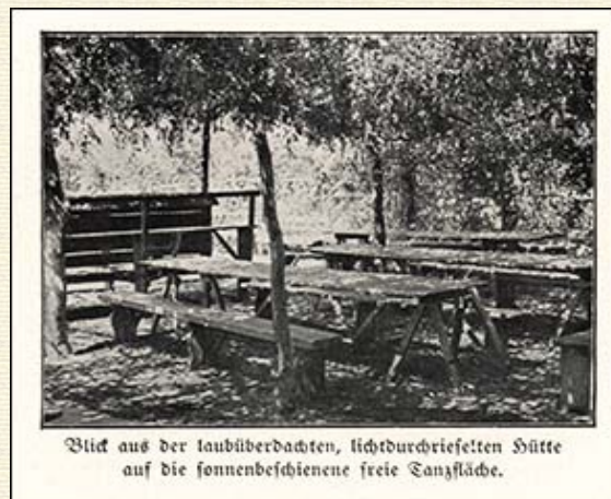
Blick aus der laubüberdachten, lichtdurchrieselten Hütte auf die sonnenbeschienene freie Tanzfläche.